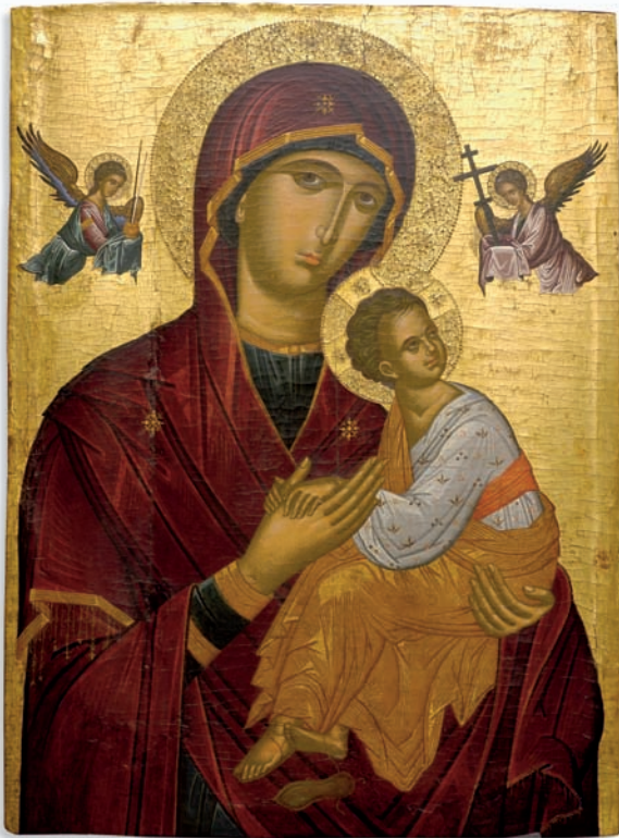
Gottesmutter der Passion, griechisch (Kreta), Ende 15. Jahrhundert