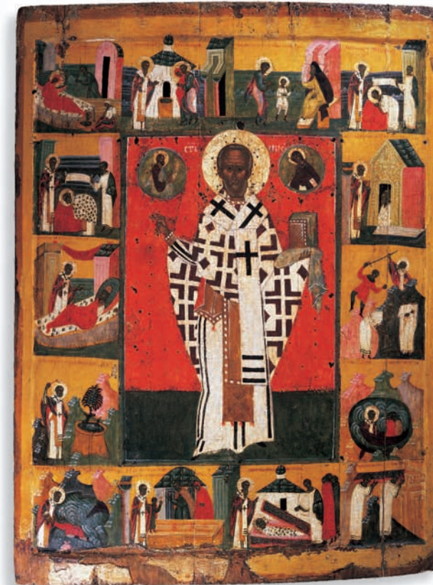
Nikolaus mit Vita, russisch (Novgorod), Ende 15. Jahrhundert