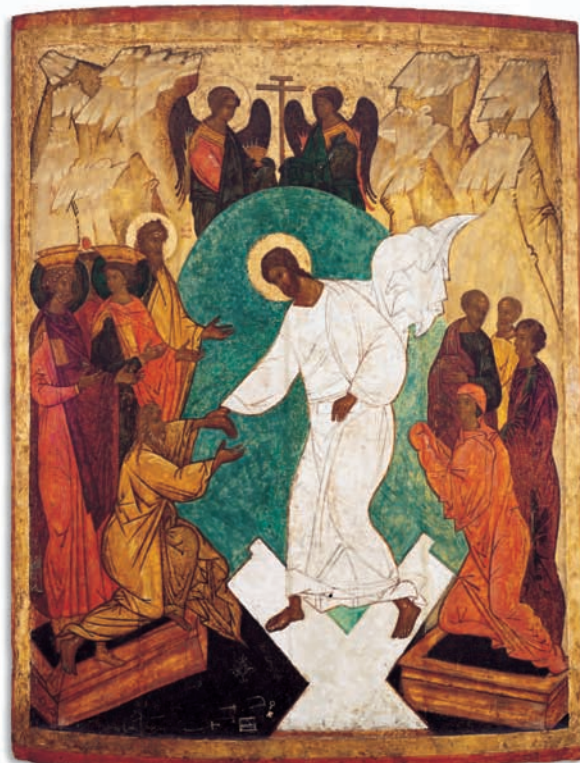
Christi Auferstebung (Höllenfahrt), russisch, Anfang 16. Jahrhundert

Het Iconen-Museum Recklinghausen, dat in het jaar 1956 geopend werd, is het belangrijkste museum van de Oosterse kerkelijke kunst buiten de Orthodoxe landen. Meer dan 1000 iconen, weefsels, miniaturen, hout- en metaalwerken uit Rusland, Griekenland en andere Balkanstaten geven een omvangrijk overzicht van de veelzijdige thema's en de stylistische ontwikkeling van de schilderkunst en de kunstnijverheid in het christelijk Oosten. Een uit hout gesneden iconostase geeft een indruk van de standplaats der iconen in de Orthodoxe kerk.