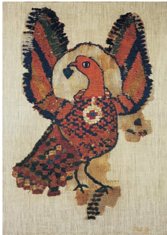
Stoff mit Adlermotiv, ägyptisch, 6./7. Jahrhundert