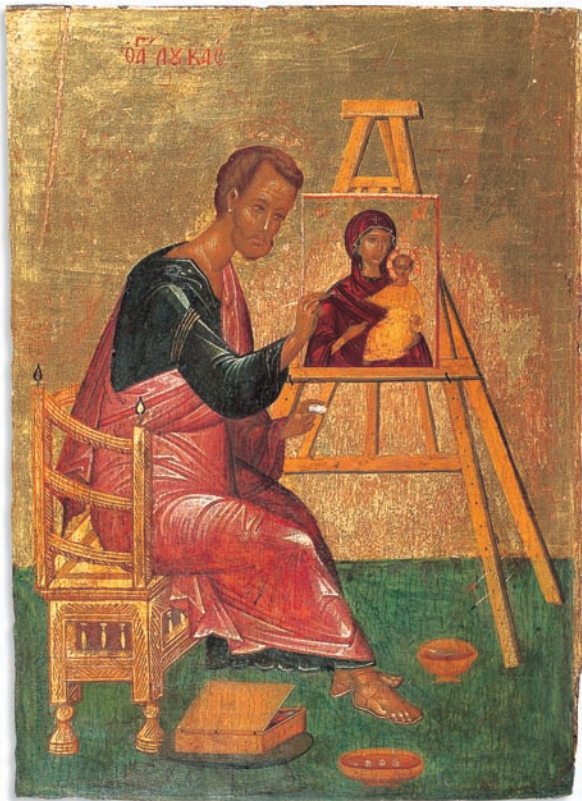
Lukas malt die Gottesmutter, griechisch (Kreta), Anfang 15. Jahrhundert

Le Musée des Icônes de Recklinghausen, inauguré en 1956, est le musée d'art religieux oriental le plus important situé hors des pays orthodoxes. Plus de 1000 icônes, des broderies, des miniatures, des objets travaillés dans le bois et le métal en provenance de la Russie, de la Grèce et d'autres pays balkans donnent un vaste aperçu de la diversité des thèmes ainsi que de l'évolution stylistique de la peinture des icônes et des arts mineurs dans le monde chrétien oriental. Une iconostase sculptée en bois donne une idée de la localisation des icônes dans les églises orthodoxes.